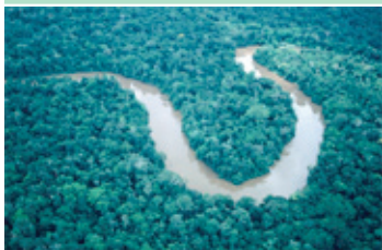
El Río Amazonas de Brasil y la deforestación de la zona.

Ver "Forest Up in Smoke" [La selva se hace cenizas] en: http://youtube.com/skin_slj2y